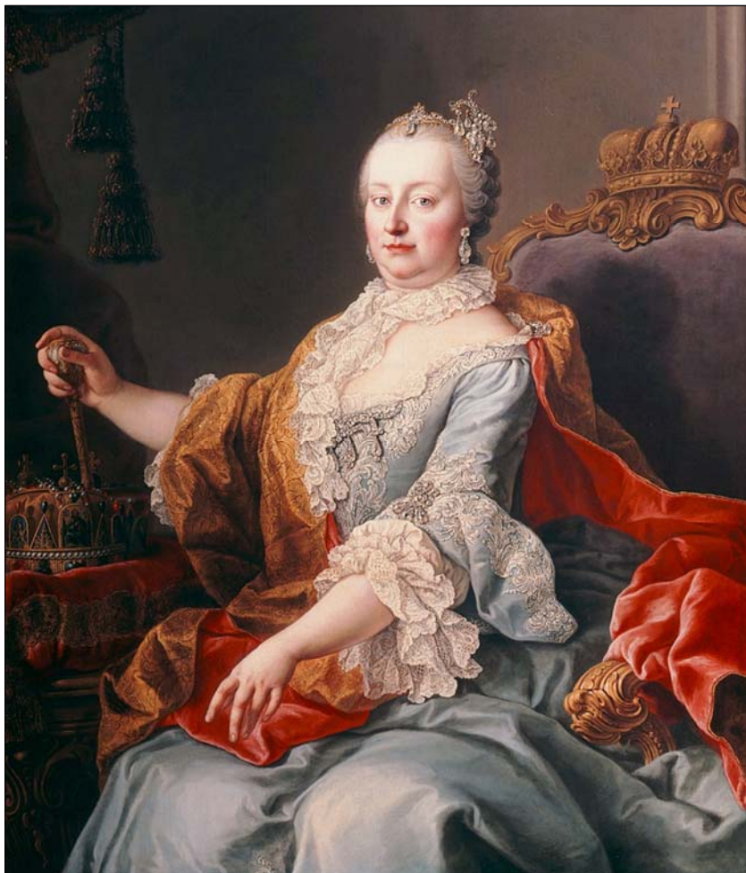
Marie Terezie Valpurga Amálie Kristýna Habsburská (13. května 1717 29. listopadu 1780)

Za poslední roky zde každé volby zářila nějaká hvězda. V roce 1998 to byla unie rebelů tzv. Sarajevského atentátu, poté oslovila voliče chuť chovat se ekologicky a v posledních volbách to byla agitka „Res publica“. (nelatinici si snadno najdou ve slovníku). Zdá se, že český volič je nepoučitelný a znova se hodlá pouštět do experimentů na živém organismu a to svém vlastním a všemi možnými prostředky se hodlá znova připravit o iluzi nového angažovaného vůdce, který mávnutím ruky dovede vše vyřešit. Viditelně komerční projekt přímo vybízející svým jménem k souhlasu asi uvažuje, že co volič to idiot.